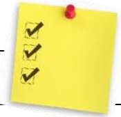
TABLEAU SYNTHÈSE FRAIS DU SERVICE DE GARDE