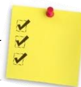
TABLEAU SYNTHÈSE FRAIS DU SERVICE DE GARDE